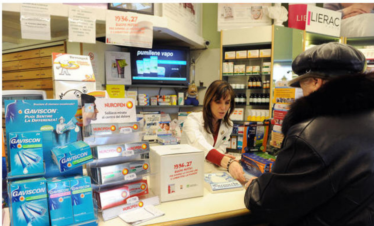
Gli interni di una farmacia tradizionale

TAG: FARMACIE FRANCHISING PANORAMA IN EDICOLA